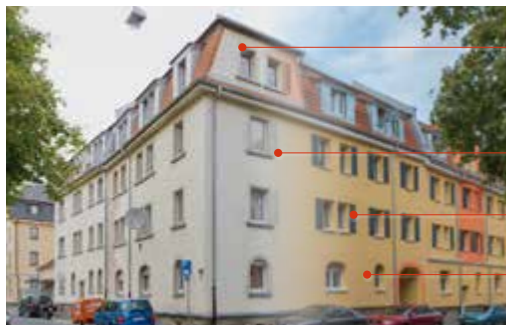
Bad Kreuznach, Steinkaut