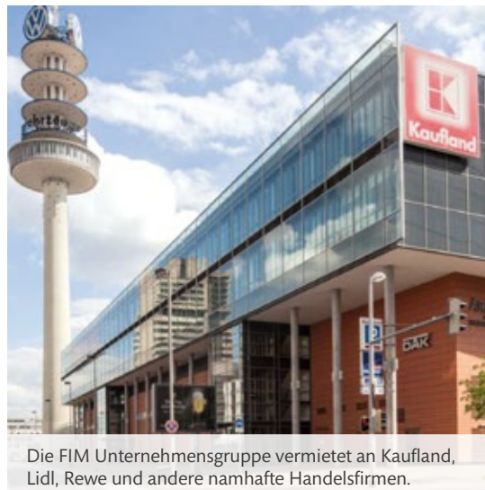
Die FIM Unternehmensgruppe vermietet an Kaufland, Lidl, Rewe und andere namhafte Handelsfirmen.

Dies führt zu Einkaufspreisen, welche selbst Mitbewerber staunen lassen.